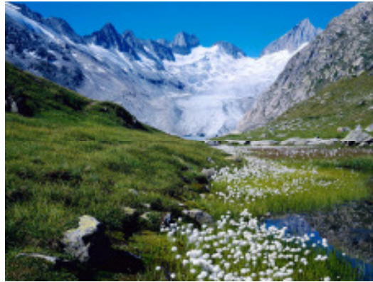
Ursprung der Aare