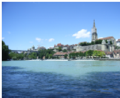
Aare bei Bern

Die erste weltweite Aktion des Lebensnetz Geomantie Wandlung und damit auch unserer Gruppe fand bereits am 10. August 1999 statt. Am Vorabend der totalen Sonnenfinsternis verband sich jede der 40 Gruppen, die sich an 40 Orten vor allem in Europa versammelten, in einer vorgegebenen Reihenfolge mit allen andern. Trotz mehr als 30 Personen und auf der zusammen. Einen schwungvolleren wünschen können!