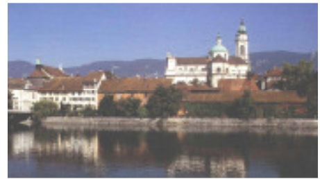
Aare bei Solothurn