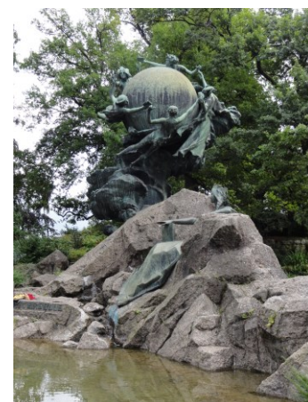
Weltpostdenkmal (Kleine Schanze)