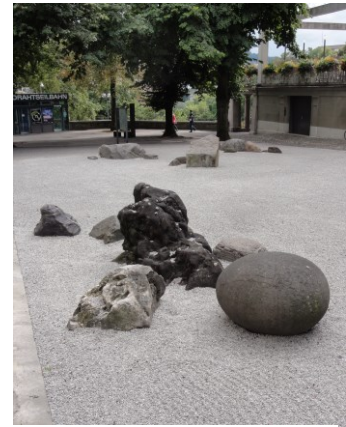
Zen-Garten beim Bundeshaus