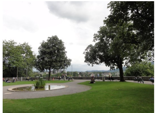
Park der Bundeshaus-Terrasse West in Bern Die Berge sind wegen den Wolken nicht sichtbar

- Wir bitten die göttlichen Wesenheiten, durch die Kanäle zu den Bergen und von den Bergen Licht in denje