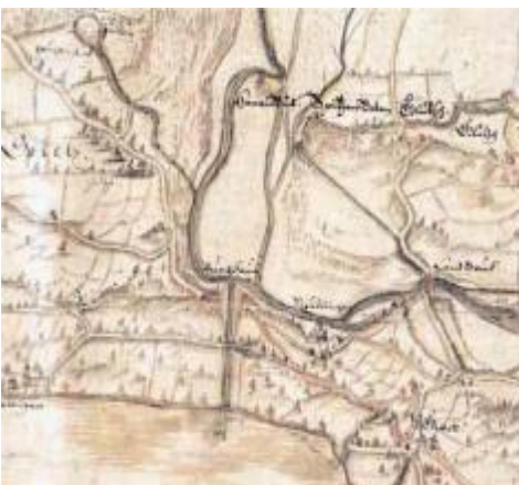
Plan des Kanderdurchstiches