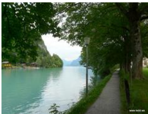
Aarekanal bei Interlaken

Unsere kleine Gruppe nahm sich im letzten Jahr ja vor, vor allem die Quellen und verborgenen Heilquellen dieser Gegend zu suchen. Einiges ist uns geglückt, anderes musste noch warten, da sich neue Orte „gemeldet“ haben. Die Gegend von Interlaken zum Beispiel. Einmal verbrachten wir eine wunderschöne Zeit mit dem Pedalo auf dem See, was sehr erbauend war! So planen wir in diesem Jahr, den Verlauf der Aare durch Interlaken, die Austrittsstelle aus dem Brienersee zu erkunden. Vielleicht melden sich auch Orte an diesem See, den die Aare ja auch durchfließt.