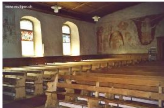
Innenansicht der Kirche Reutigen

für die Versuche im 18. Jh., die Flüsse und Bäche zu bändigen. Ursprünglich floss die Kander nicht in den See, sondern in etwa dem heutigen Verlauf des Glütschbachs folgend, nördlich von Thun bei Uttigen in die Aare. 1711 begannen die Arbeiten an einem Durchstich des Möränenhügels in der Nähe von Einigen/Gwatt. Ein Stollen sollte es werden. Doch die Kraft des Wassers liess den Hügel zusammenstürzen, und seither gräbt sich die Kander ihren Weg immer tiefer in das Steingefüge. Kaum vorstellbar, dass davor die Kander beim Zusammenfluss mit der Simme viel Platz hatte sich zu vermählen, sich auszutauschen. Heute lässt die weite, nun landwirtschaftlich genutzte Ebene bei Reutigen uns dies nur erahnen. Interessant ist in diesem Zusammenhang auch, dass der Erbauer der 12 Thunerseerkirchen, König Rudolf der 2. von Hochburgund, seinen Sitz auf der Burg Strättligen hatte. Er schaute also auf den Fluss und den See. Seine Frau Bertha liess die Kirche von Reutigen erbauen! War sie wohl von dem Strömen, Ineinanderweben, dem sich hingebenden Spiel der beiden sich verbindenden Flüsse inspiriert?