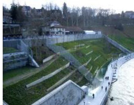
Bärenpark, von der Nydeggbücke aus

Im November wollten wir den neuen Bärenpark geomantisch mit der Stadt verbinden. Wir ahnten nicht, dass sich kurz darauf Tragisches im Bärenpark ereignen würde. Am alten Bärengraben baten wir die Gattungseele der Bären um Vergebung für alles, was wir Berner ihr in den vergangenen Jahrhunderten angetan haben. Nach Transformation alter und schlechter Energien verbanden wir die noch neue, zarte Bärenkraft mit den Altstadtchakren und baten alle beteiligten Wesenheiten um Unterstützung. Vielleicht hat das dann so viel Mitgefühl ausgelöst für den Bären Finn, den verunglückten Mann und den Polizisten.