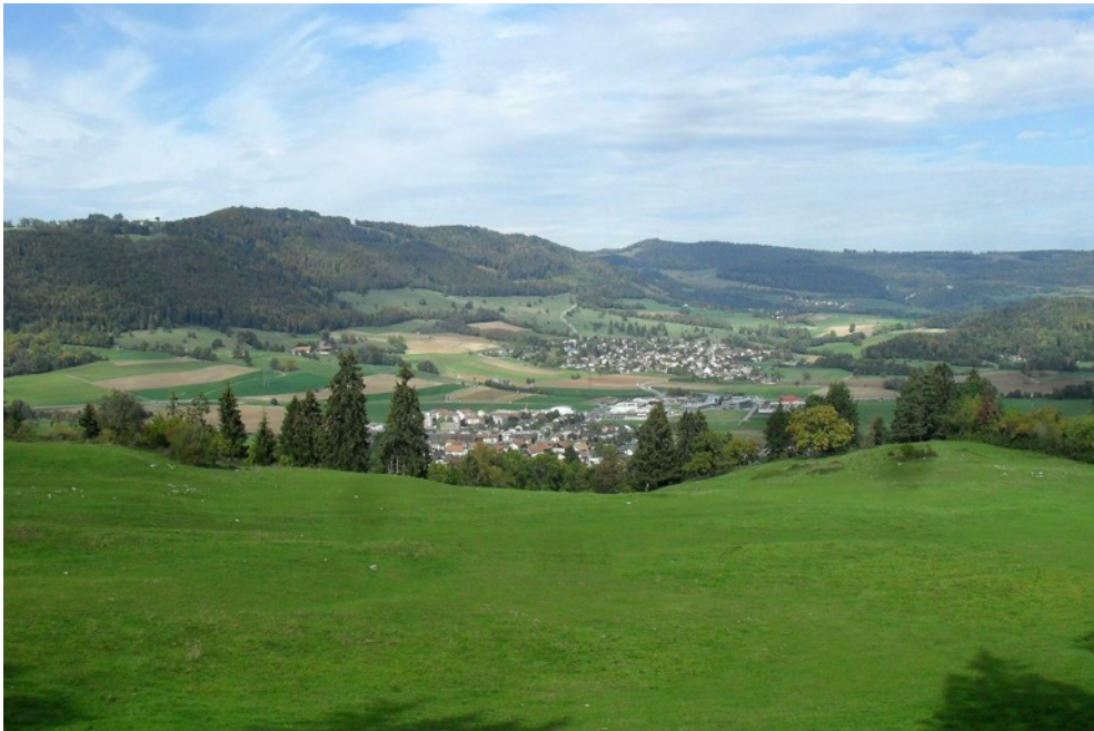
Aussicht vom Jolimont nach Norden auf das Dorf Glovelier.

Der bevorstehende Wandertag soll wiederum Mitglieder verschiedener Organisationen mit sozialer, ökologischer oder spiritueller Ausrichtung zusammenbringen. Unterwegs wird sich jede Organisation kurz vorstellen. Damit bietet der Anlass einen ungezwungenen Rahmen, um miteinander ins Gespräch zu kommen und sich zu vernetzen. So stärken wir uns gegenseitig auf dem Weg zu einer wünschenswerteren Gesellschaft.